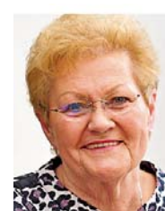
Gesundheitsministerin Monika Bachmann (CDU) sieht die Notfallmedizin gestärkt.

SHG-Klinik, saarländische Unfall-opfer in französischen Krankenhäusern versorgt werden können. Für solche Behandlungen im Ausland ist künftig keine Genehmigung der Krankenkasse mehr erforderlich. Durch die Vereinbarung werde „eine durchgehende Gesundheits-