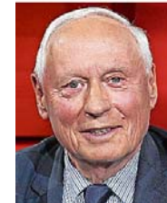
Oskar Lafontaine will neue politische Mehrheiten.

BERLIN/SAARBÜCKEN (dpa) Führende Politiker von Linken und SPD haben einer Fusion beider Parteien ein Abfuhr erteilt. Sie war durch angebliche Äußerungen vom früheren Bundesvorsitzenden und jetzigen